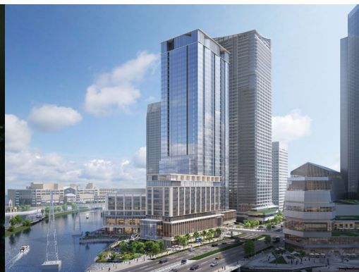
ホテル外観イメージ 2